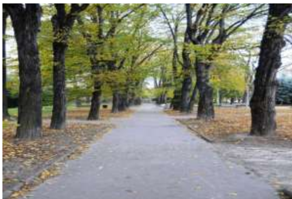
Fig. 2. Past avenue trees in the city garden